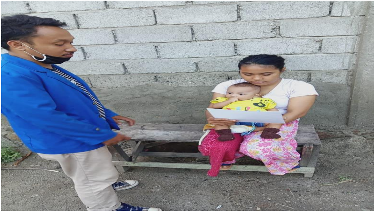
WAWANCARA DENGAN RESPONDEN MENGGUNAKAN KUESIONER