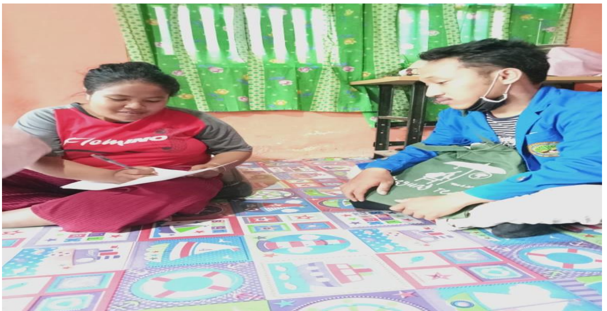
WAWANCARA DENGAN RESPONDEN MENGGUNAKAN KUESIONER