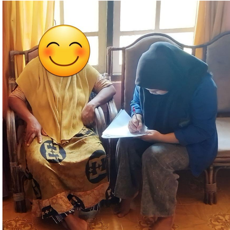
Dokumentasi bersama responden tuberkulosis paru di Dusun 3 Desa Parigimpu'u