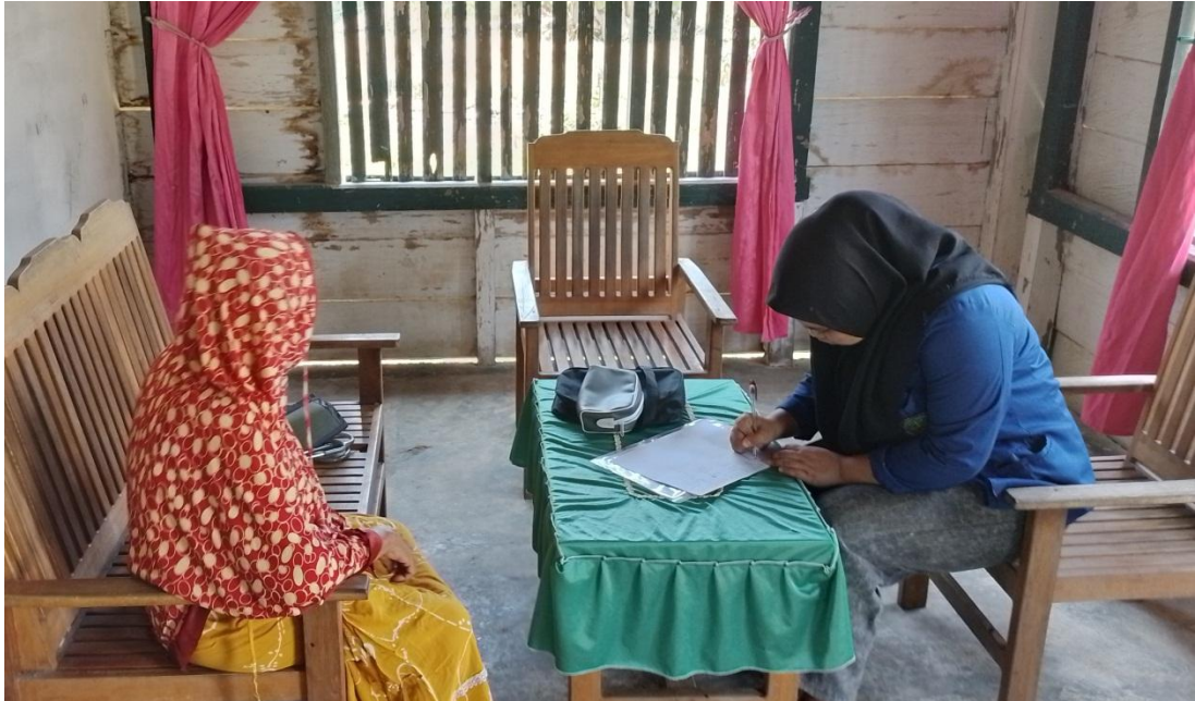
Dokumentasi bersama responden tuberkulosis paru di Dusun 3 Desa Parigimpu'u