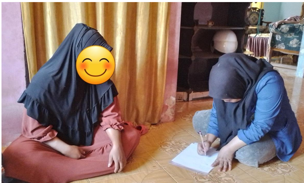
Dokumentasi bersama responden tuberkulosis paru di Dusun 1 Desa Parigimpu'u