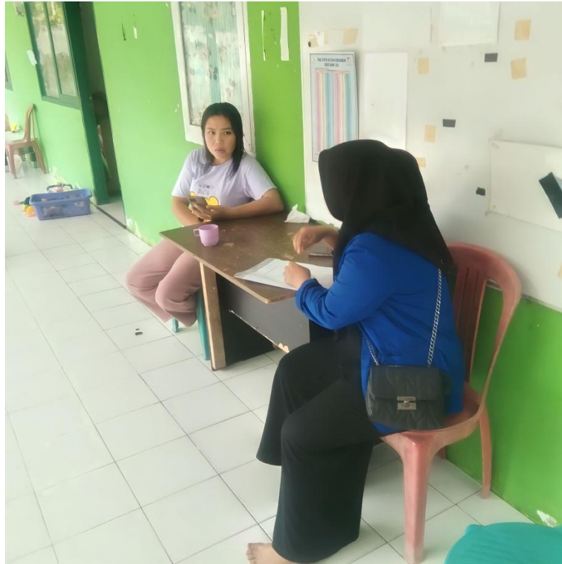
Dokumentasi pengambilan data nama serta alamat penderita TB kepada ibu Bidan Desa Parigimpu'u