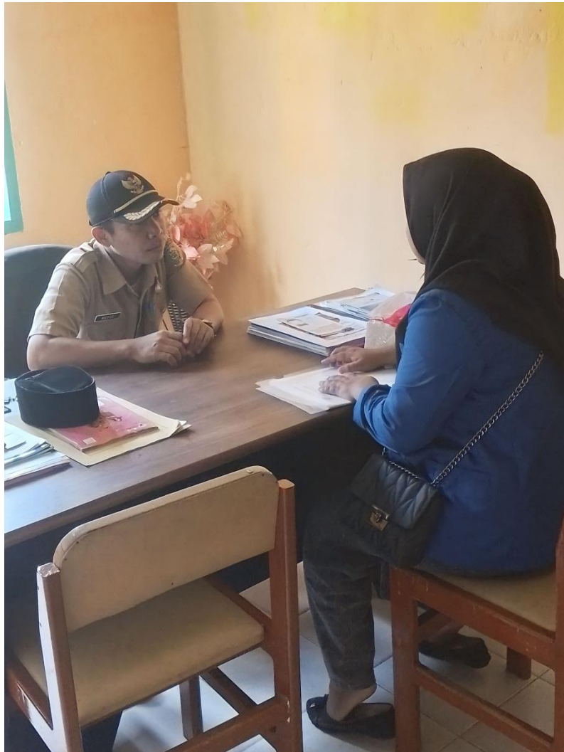
Dokumentasi pengantaran surat izin meneliti kepada Kepala Desa Parigimpu'u