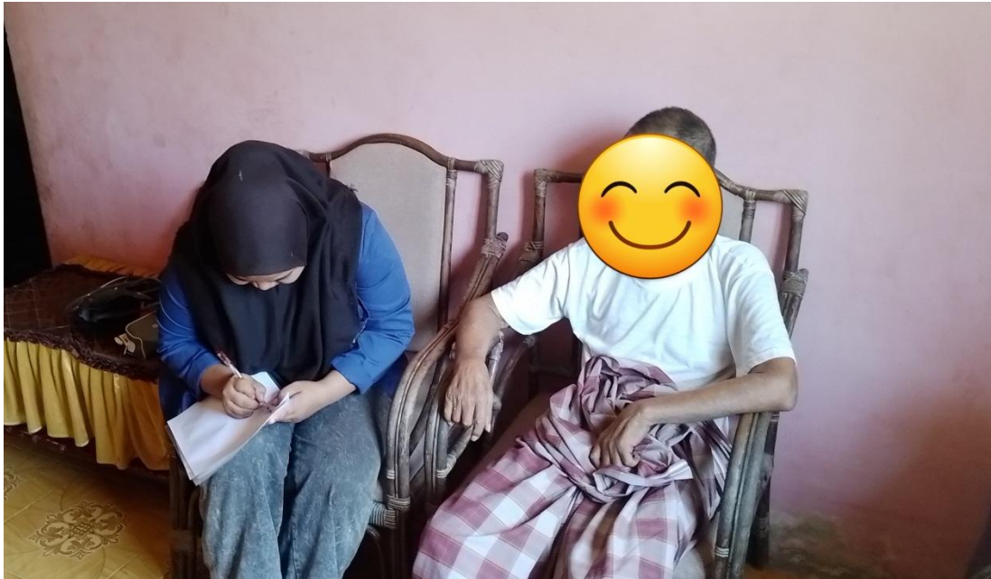
Dokumentasi bersama responden tuberkulosis paru di Dusun 2 Desa Parigimpu'u