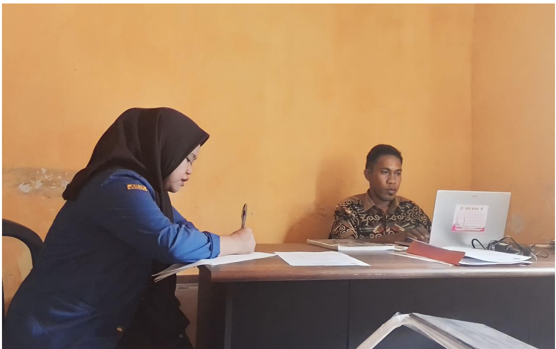
Dokumentasi pengambilan profil desa dan surat balasan kepada bapak Sekretaris Desa Parigimpu'u